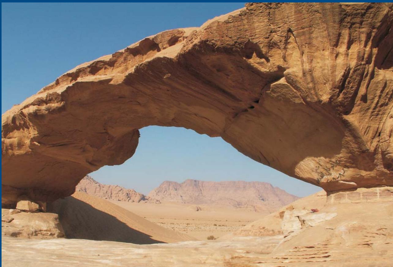
Ryc. 7. Most skalny Burdah w masywie Burdah na pustyni Wadi Rum.