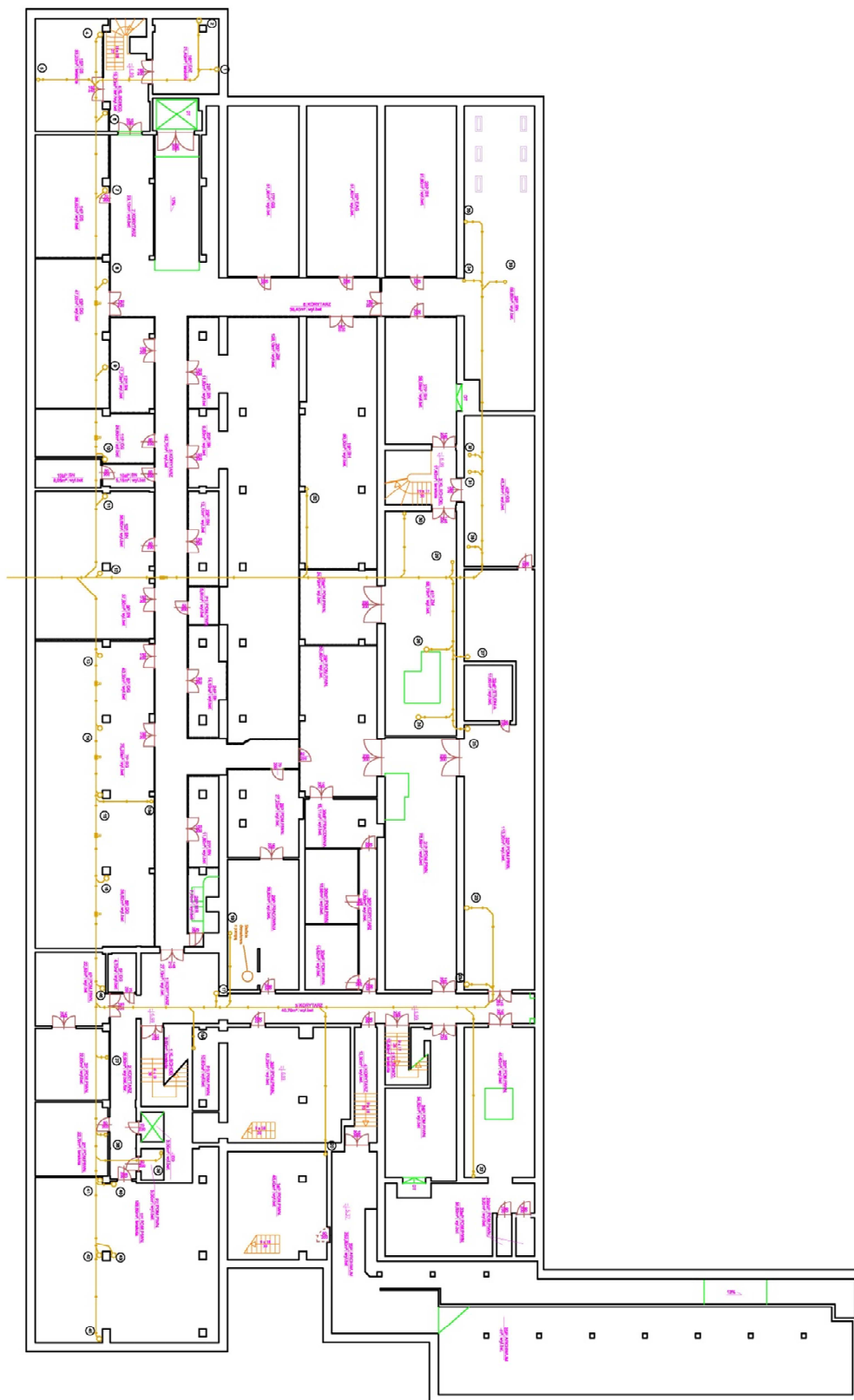
Rzut poglądowy istniejących instalacji